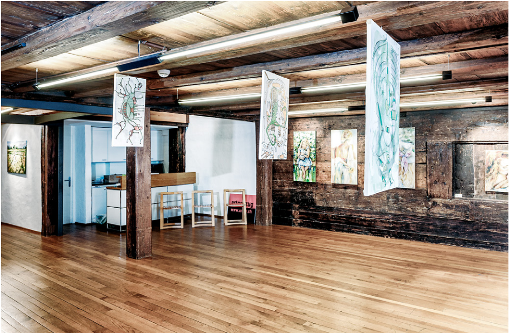
1. Obergeschoss mit Kochnische