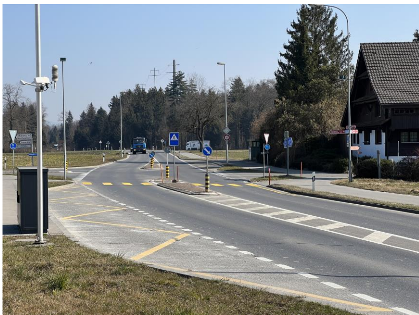
Die Bushaltestellen beim Konten Matten werden rückgebaut.